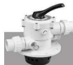
† Válvula multiport de seis posiciones