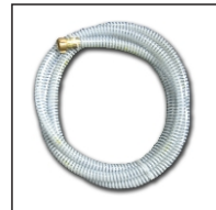
Manguera de Alimentación

Hidrolimpiadoras de uso profesional, de alto rendimiento y fiabilidad. Ideal para aplicaciones industriales gracias a su potente motor, su chasis reforzado y a su facilidad de transporte. Se desplaza fácilmente sobre cualquier superficie. No requiere de suministro eléctrico. Su alta presión permite un acabado sobresaliente ante cualquier necesidad de limpieza, desincrustación, etc. Con estos nuevos equipos Sánchez&Cia Industrial S.A. continúa ampliando su línea de productos para el servicio de nuestros clientes.